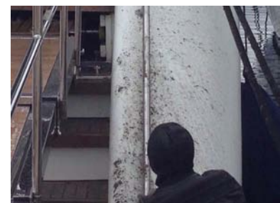
Ej. de imagen del siniestro.