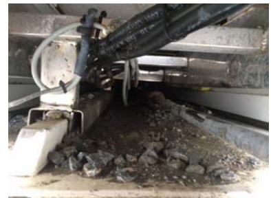
Ej. de imagen del siniestro.

seguro, muchas de estas “pruebas” del accidente ya no estén presentes. Toda esta información facilitará enormemente las cosas, el seguro lo agradecerá y sobre todo no tendrá opciones a decir que el incidente no ocurrió o ha sido distinto de lo que nosotros decimos.