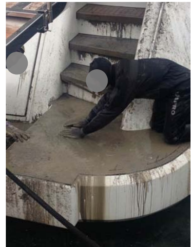
Ej. de imagen del siniestro.